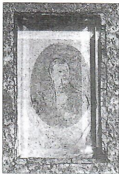
Фотаздымак на пахаванні Глябовіча

Сёння надмагільныя фотаздымкі сталі такой звычайнай часткай беларускіх могілак, што рэдкасцю можна назваць помнік без партрэта памерлага. Гэта традыцыя асабліва расквітнела ў апошнія дзесяцігоддзі з пашырэннем новых спосабаў нанясення выяваў на камень, якія дазваляюць, пры жаданні, рабіць нават паўнароставыя выявы блізкіх, а апошнім часам – і карыстацца каляровымі здымкамі.